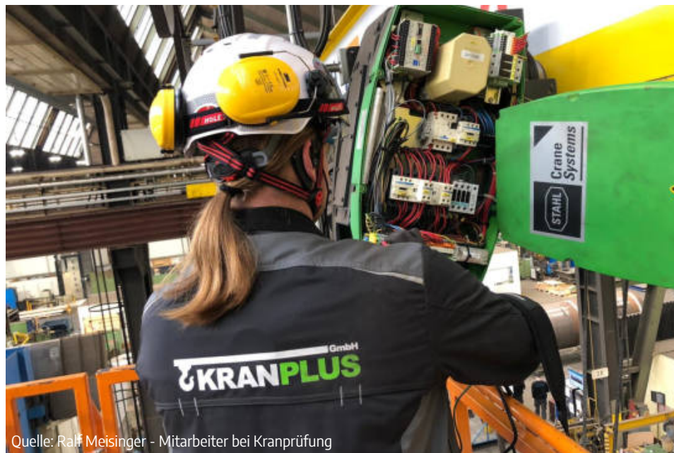
Mitarbeiter bei Kranprüfung